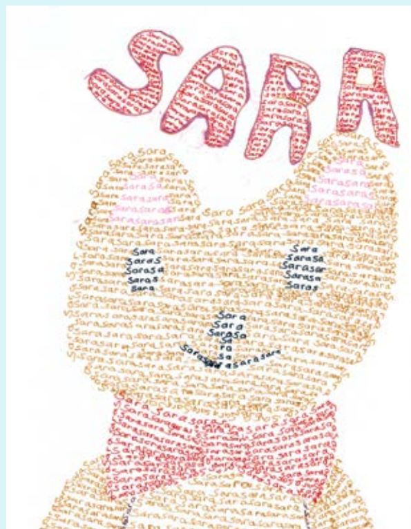
Prilog jednom rečniku u slikama, 4. razred