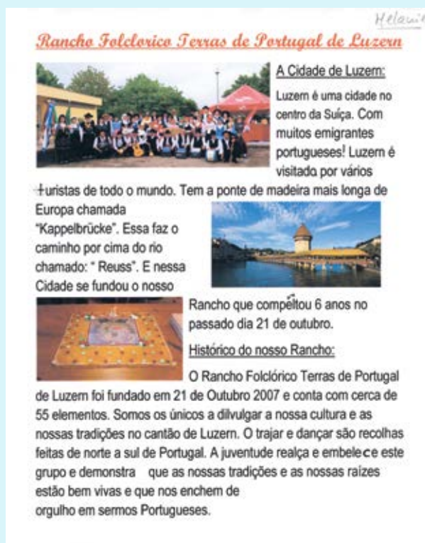
Jedan od tri lista u prezentaciji jedne portugalske folkorne grupe (8. razr.)