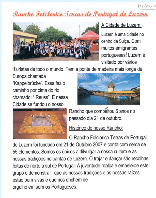
Një prej tri fletëve për prezantimin e një grupi folklorik portugez (klasa 8)