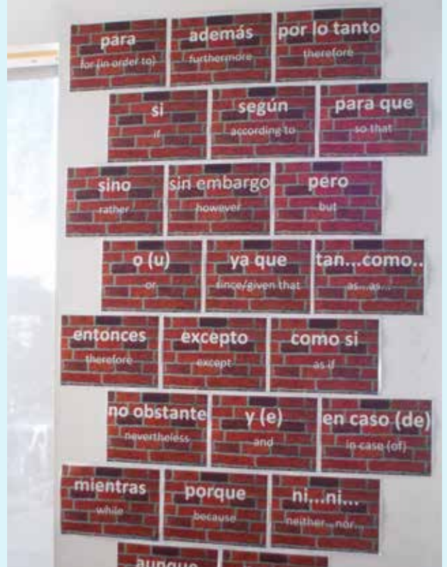
(இவற்றை மீள காட்சிப்படுத்த ஒப்புதல் வழங்கிய ஸ்பானிஷ் பா.மொ.க ஆசிரியர்களுக்கு மிகுந்த நன்றிகள்)